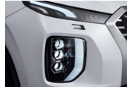
פנסים ראשיים מסוג LED