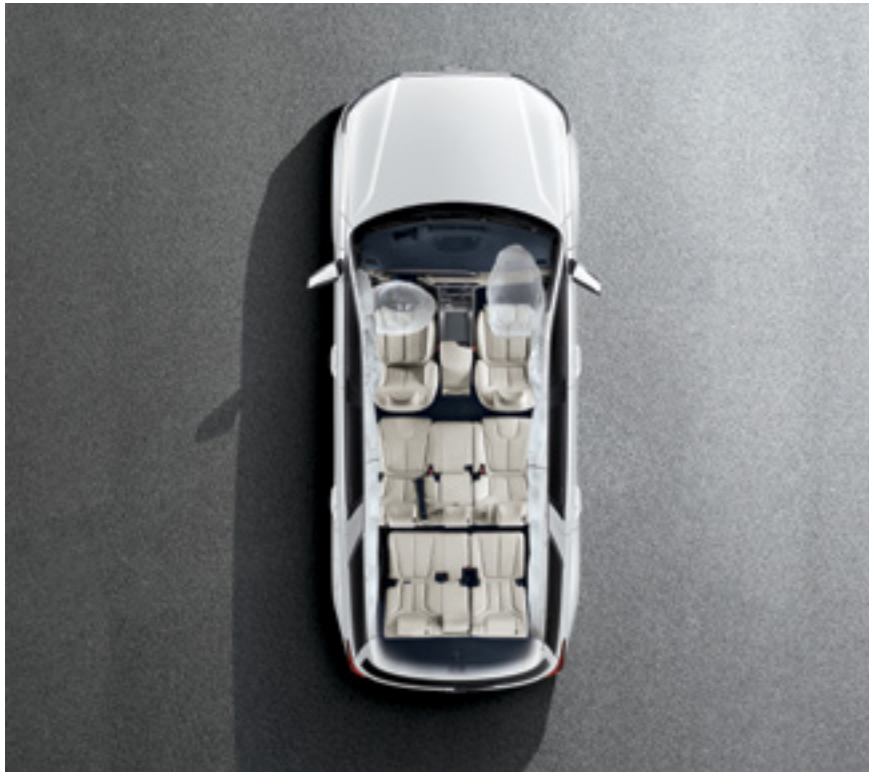
7 כריות אוויר

יונדאי פליסייד מצויד ב-Hyundai SmartSense, מערכות בטיחות מתקדמות המבוססות על טכנולוגיות הבטיחות האקטיבית העדכניות ביותר, כדי להעניק לכם יותר בטיחות ויותר שקט נפשי.