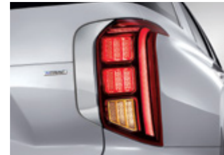
פנסים אחוריים LED