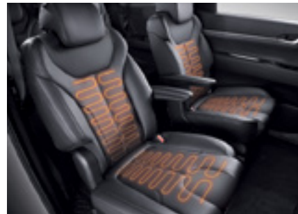
חימום מושבים קדמיים ואחוריים