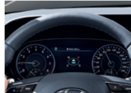
מסך TFT LCD בגודל 7"