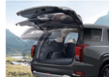
דלת תא מטען חשמלית חכמה