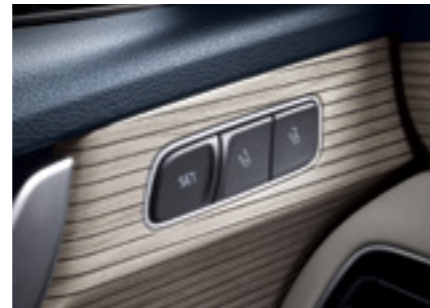
זכרונות למושב נהג*