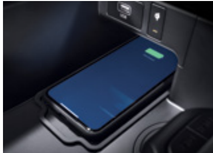
משטח טעינה אלחוטי