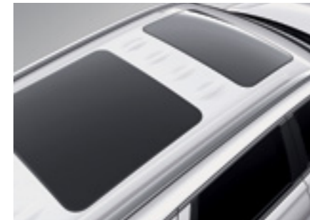
גג שמש פנורמי נפתח כפול*