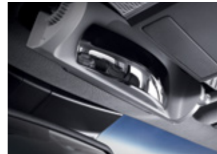
מראה פנורמית לפני הרכב