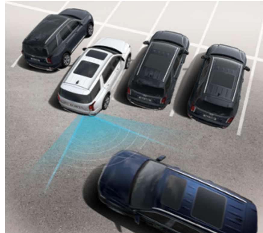
התרעה ומניעת פגיעה ברכב חוצה מאחור (RCCA)

מערכת אקטיבית להתרעה ומניעת פגיעה ברכב חוצה בעת נסיעה לאחור.