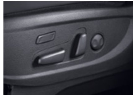
מושב נהג חשמלי