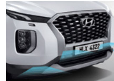
חיישני חניה קדמיים + אחוריים מקוריים