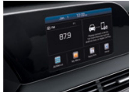
מערכת מולטימדיה עם מסך בגודל 8"