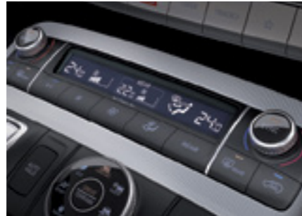
בקרת אקלים תלת איזורית