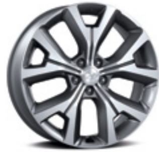
חישוק סגסוגת 20"