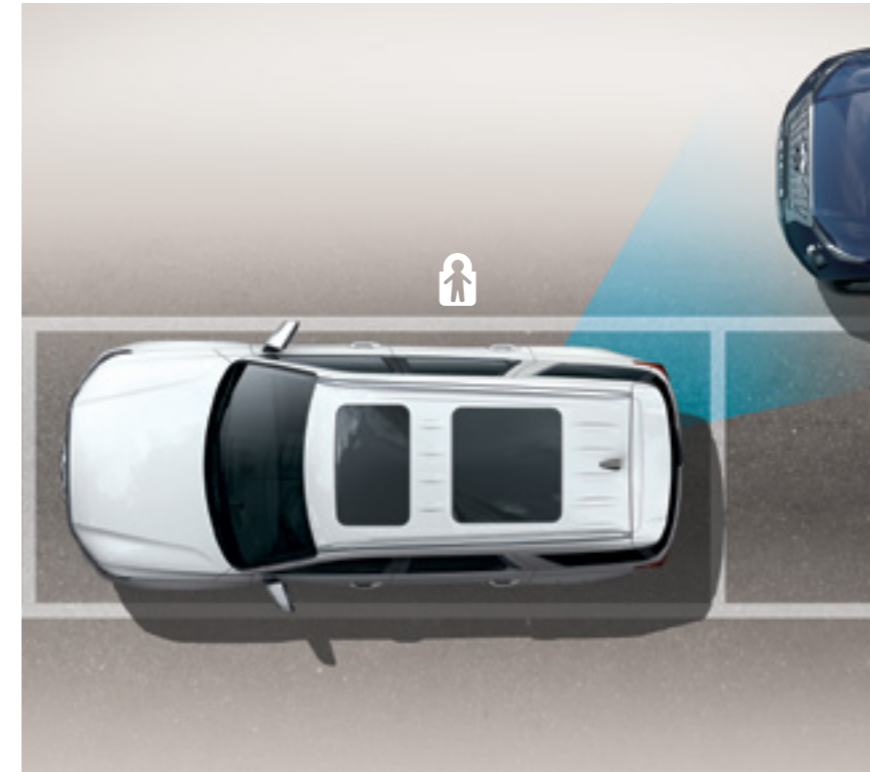
מערכת יציאה בטוחה מחנייה (SEA)

מערכת אקטיבית להתרעה ומניעת פגיעה ברכב חוצה בעת נסיעה לאחור.