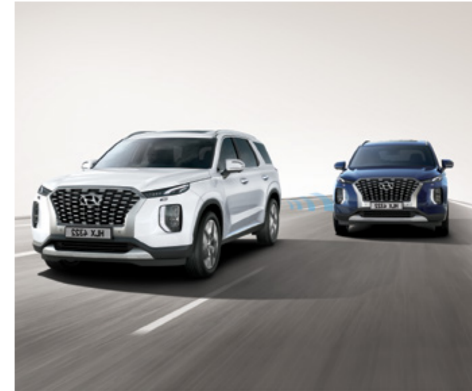
מערכת אקטיבית לזיהוי ומניעת התנגשות בכלי רכב ב"שטח מת" (BCA)

מערכת "יציאה בטוחה" המתריעה ומונעת פתיחת דלתות המושב האחורי במקרה של רכב חוצה.